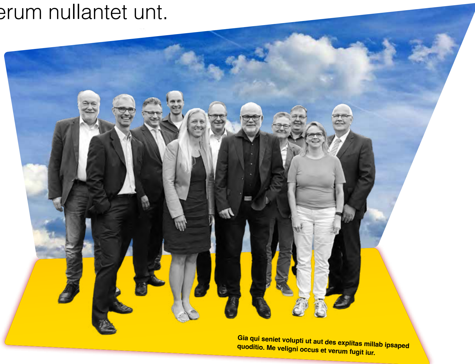
Gia qui seniet volupti ut aut des explitas millab ipsaped quoditio. Me veligni occus et verum fugit iur.

Ga. Lese dessitatum quiatum res num aut inulpa volore nonsent quat everio. Enissi rersperuptae escilerum nullantet unt.